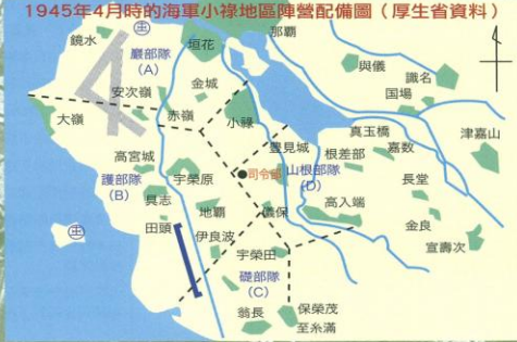
1945年4月時的海軍小祿地區陣營配備圖 (厚生省資料)