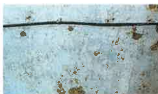
参谋室 靠近司令官室·作战室,这里至今遗留着参谋们自尽时使用的手榴弹残片。