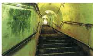
司令部壕入口阶梯 105级台阶,长30米左右,连接壕内纵横交错的通道。

司令部壕当时全长450米,是日本海军设营队于1944年修筑的。选址原因主要有「地势较高,视野开阔并靠近海军小禄机场(现在那霸机场)。即可抵御美军舰炮火的轰炸,适合持久战,又能肉眼观察敌我军情,便于掌握战况且无通信障碍」等一些理由。当时,固守这里的士兵为4,000名。战后一段时间之后,发现并分批收集了约2,400具遗骨。其后,于1970年对外开放了其中300米沟壕。此地在冲绳当地被叫做“hibanmui(火番森)”。琉球王朝时代,当有中国和海外船只入港时,就会首先在这里燃火,将来船的消息告知首里城。现在,司令部壕的周围已成为县立「海军壕公园」。从这里可看到那霸市,丰见城市内的街景,还能将东海洋面尽收眼底。这里也是离那霸机场最近的一处战争遗址。