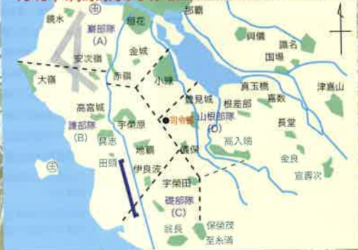
1945年4月時的海軍小壕地區陣營配備圖 (厚生省資料)