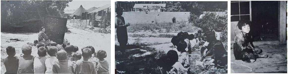
※写真：教室が無いので、青空の下で授業を受ける生徒と傷の手当てを待つ少女