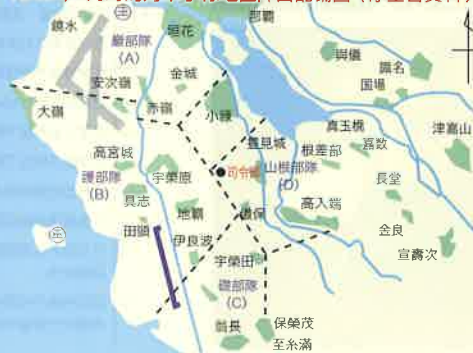
1945年4月時的海軍小祿地區陣營配備圖 (厚生省資料)